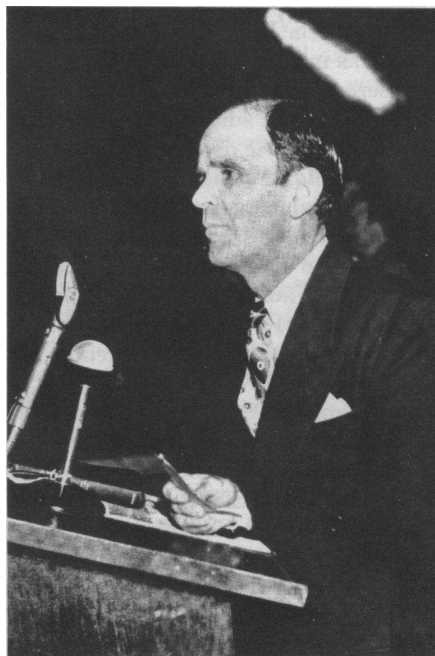
William Marrion Branham

The Pillar of Fire over Brother Branham's head was photographed at Houston, Texas, in January of 1950, and had accompanied him since his birth in 1909. During a 1933 baptismal service in the Ohio River at Jeffersonville, Indiana, this supernatural Being appeared before hundreds of people, saying to him, "As John the Baptist foreran the first coming of Christ, you will foreran His Second Coming."